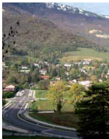
La voie 21 assurant la desserte du futur quartier

Situé entre les pentes du Moucherotte et le Rocher de Comboire, à 9 km de Grenoble, le secteur de Pré Nouvel est desservi par la voie 21, qui permet le contournement de Seyssins. La Commune aménage ce site dans la continuité de son développement historique, sous une forme urbaine intégrée à son environnement naturel. Le projet permettra de satisfaire la demande de logements, d'accroître la mixité sociale de la commune, de conforter l'activité et la pérennité des services publics de proximité et de revitaliser les écoles et les commerces existants au centre bourg.