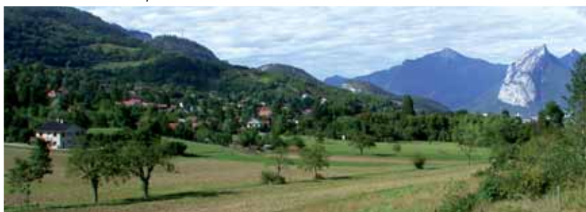
Le site existant vu depuis le sud

Pour offrir des possibilités d'habiter au plus grand nombre, l'opération comprendra 35 % de logements sociaux et proposera 4 types de programmes : six ensembles collectifs R+3, trois opérations de logements intermédiaires R+2, cinq ensembles de logements individuels groupés et huit maisons individuelles.